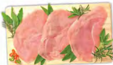
FESA A FETTE DI TACCHINO