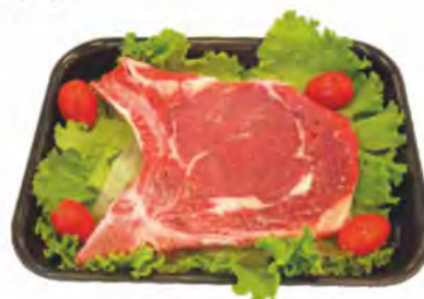
COSTATA CON OSSO DI BOVINO