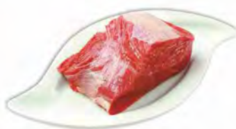
BOLLITO SENZ'OSSO DI BOVINO