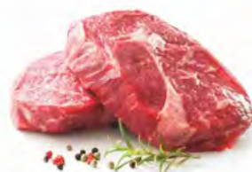
TAGLIATA DI BOVINO