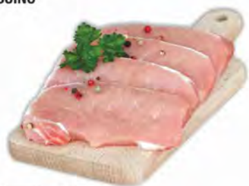
LONZA A FETTE DI SUINO