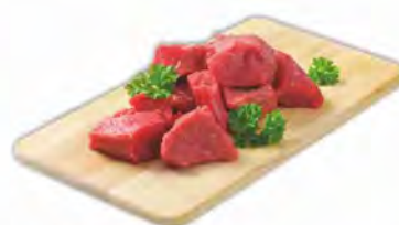
BOCCONCINI DI BOVINO