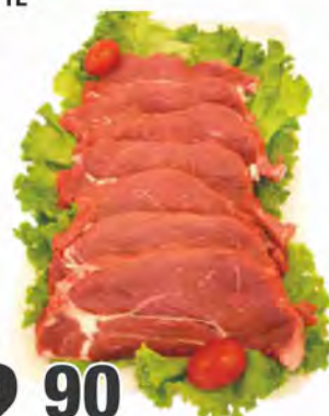
REALE A FETTE DI BOVINO